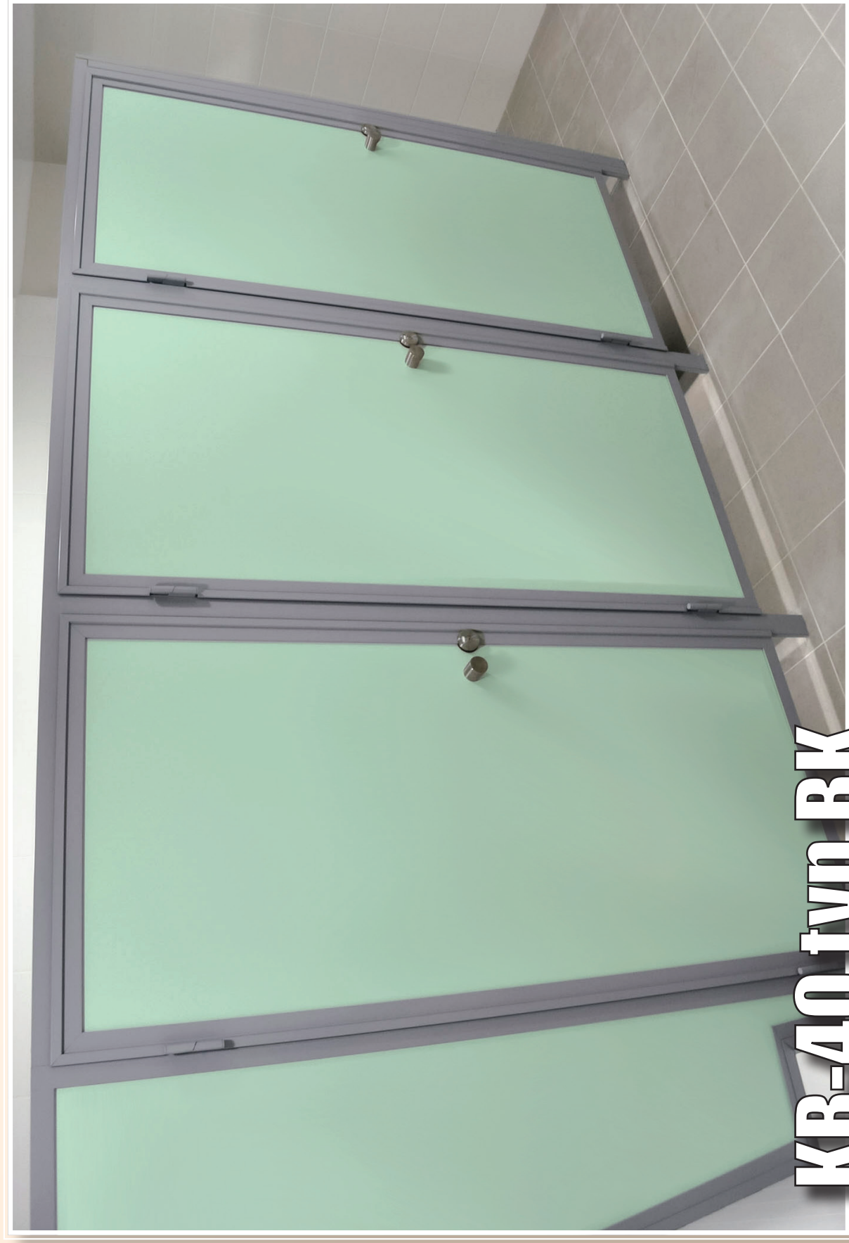
KB-40 typ BK