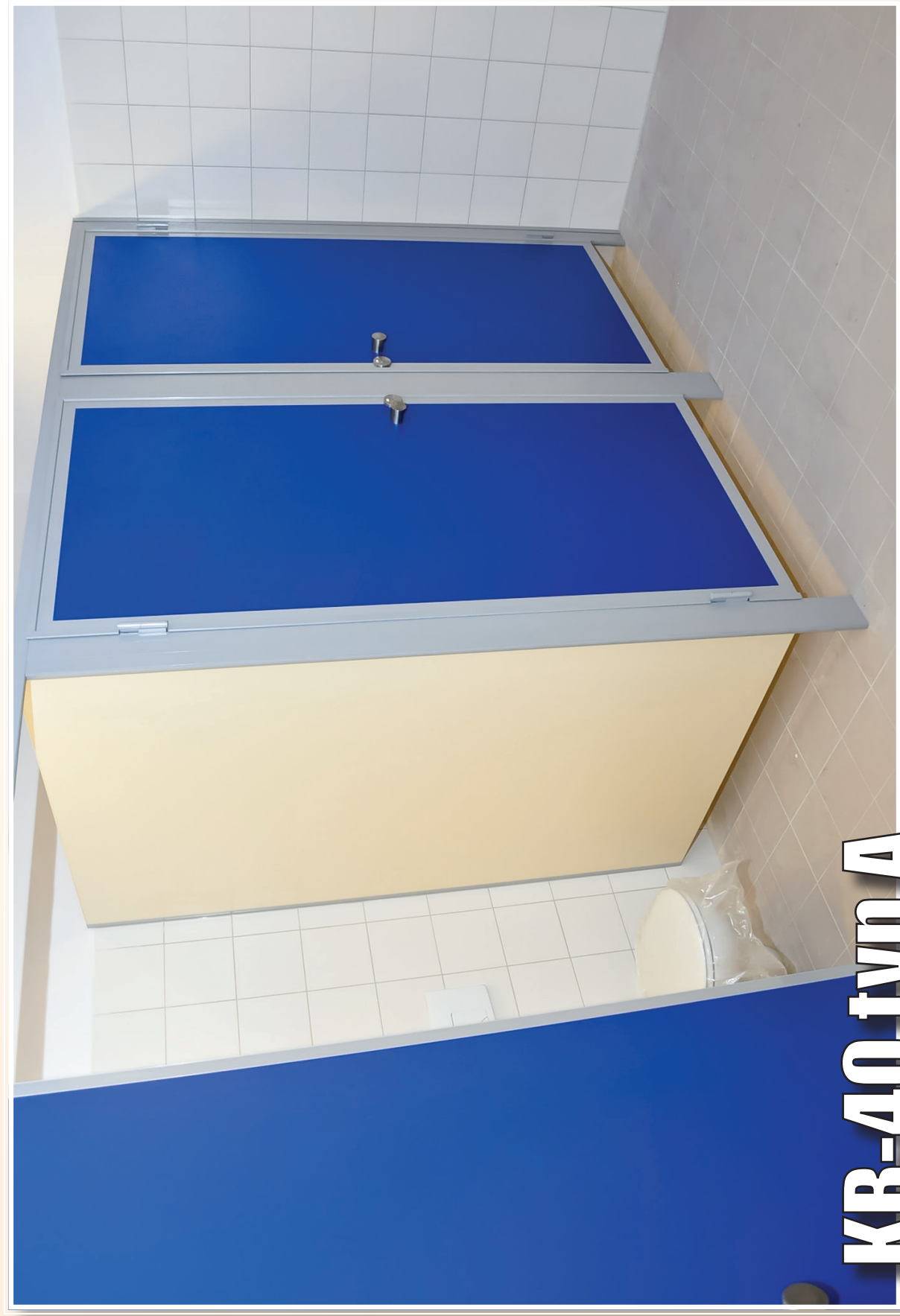
KB-40 typ A