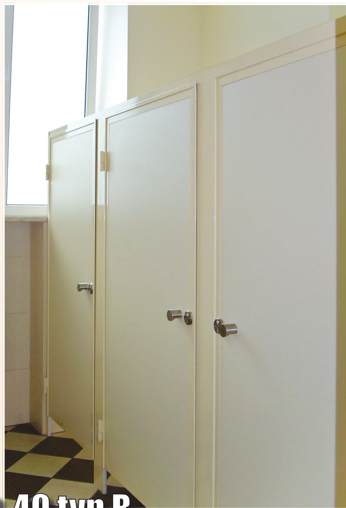
KB-40 typ B