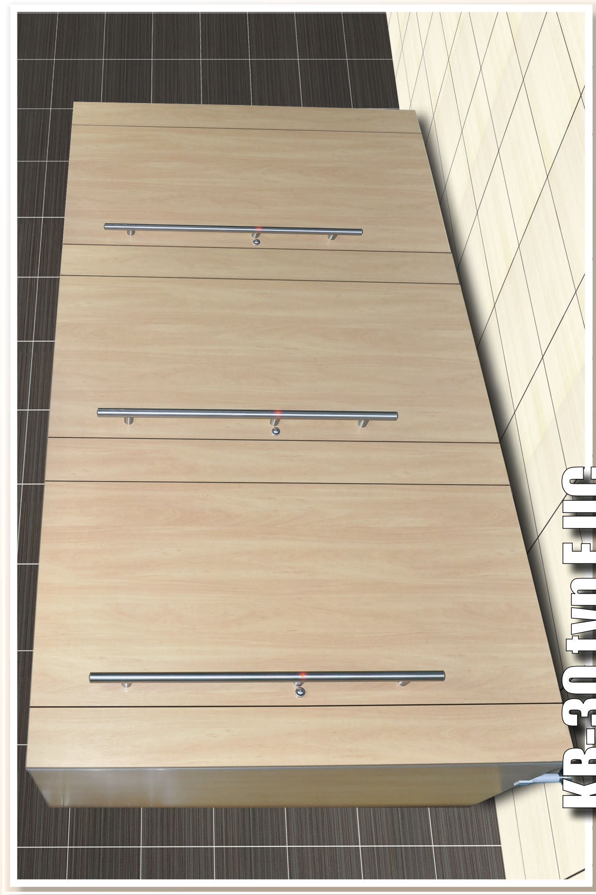
KB-30 typ EUC