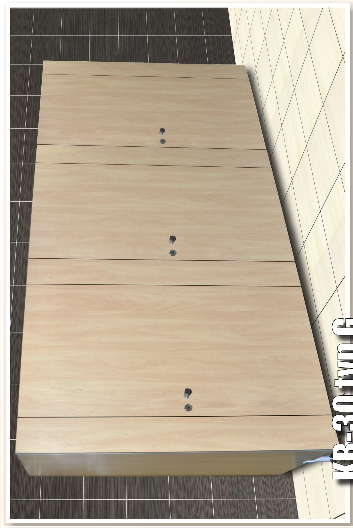
KB-30 typ G